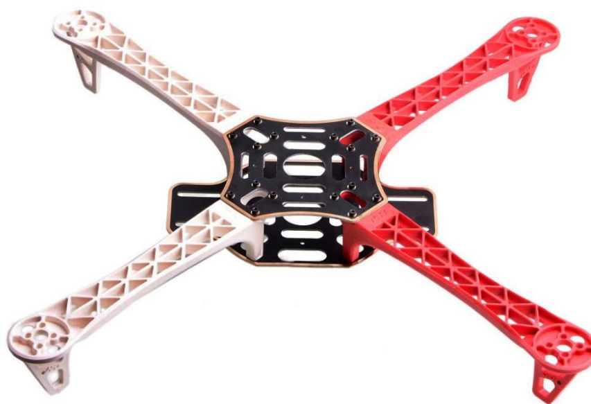
Figura 1 - Drone modelo 450

A aeronave deverá ser de asa rotativa, com motores obrigatoriamente elétricos, na configuração quadrotor , classe 450, conforme modelo apresentado abaixo: